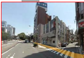
ブリーズベイホテル前から桜川橋方向の景色